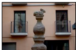
3. Font del Conill, 1666 Desconegut Plaça del Conill