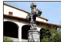
5. Creu monumental, 2003 Casadevall Mombardó, Martí Plaça del Palau