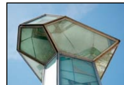
7. Vitris, 1990 Fita Molta, Domènec Plaça Santa Magdalena