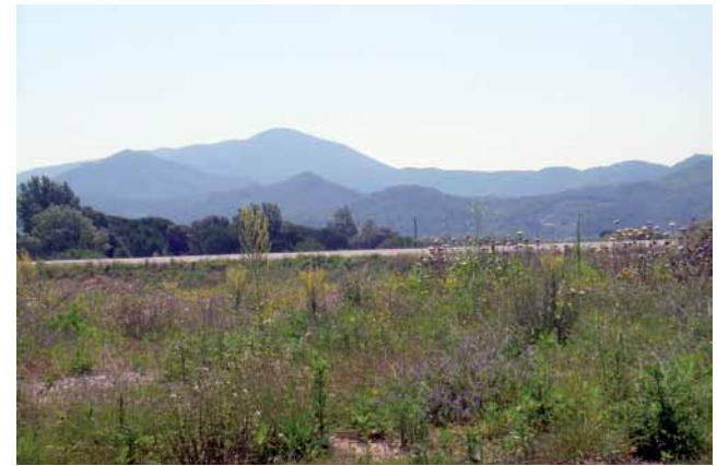
De camí cap al Pedrenyal Vell

Retornem a la rotonda i girem a l'esquerra, passant per davant de l'escorxador i la deixalleria, arribem a una altra rotonda, que fem recte ( 850 m, 9 min ). Anem per l'avinguda de la Serra i entrem al barri de la Serra (hi havia hagut una serradora) i seguim per l'avinguda de la Serra fins al final, ( 1.650 m, 17 min ) trobem un corriol que baixa cap a la Tordera, la travessem per una passera de ferro ( 1.700 m ). Al final hem de girar a l'esquerra fins arribar a l'asfalt, on girem a la dreta per passar per sota les vies de l'AVE ( 1.950 m, 20 min ). Just sortir agafem el camí de la dreta que ens porta directament davant de can Guarro ( 2.180 m, 23 min ).