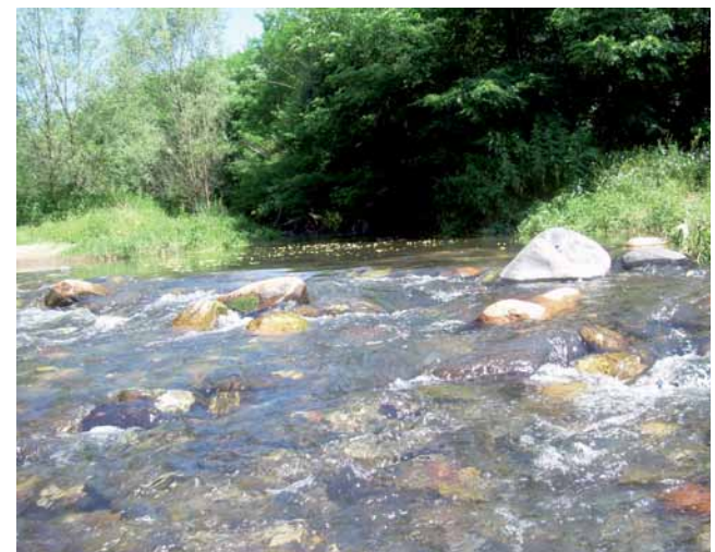
La Tordera sota Can Pagà

Podem observar magnífiques vistes del Montnegre.