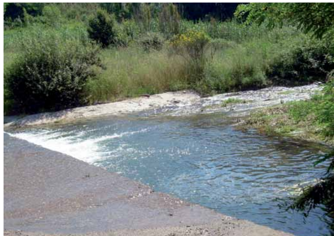
Riu Tordera, sota el molí de Can Balada

Inicialment va ser un molí d'oli i blat. Molt posteriorment, a inicis del segle passat, va passar a ser un molí tèxtil i durant la primera meitat del segle XX va ser la primera empresa elèctrica, que va donar llum al poble (Arimany).