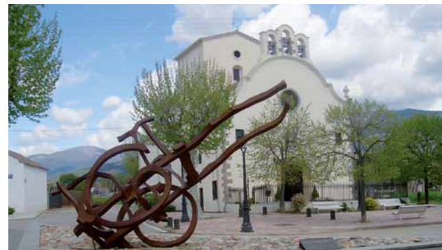
L'Ermida del Remei

Passem per davant de can Rahull, actualment seu provisional de l'ajuntament. Seguint pel mateix carrer trobem el parc Pau Casals, agafem el passeig del Remei a mà esquerra, de pujada (1.460 m, 20 min) si volem podem visitar l'Ermida del Remei. O bé per acabar el passeig, baixar pel passeig fins al carrer Major i tornar a l'Ajuntament fent un recorregut curt.