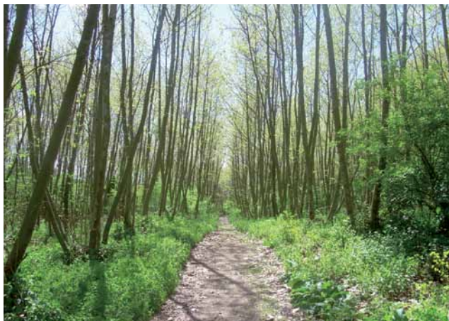
Llera del Riu Tordera

Travessem el parc fins al final, just en sortir a mà esquerra ens queden unes escales que baixen un fort pendent fins a La Tordera. Les agafem, en arribar a baix ( 2.570 m, 33 min ), podem observar uns murs de pedra seca, que van fer a principis del segle XX, per contenir la força del riu. Aquets murs, lligats amb xarxa, es poden observar en pocs llocs. Trobem un camí a mà dreta que haurem de seguir fins al final. El bosc de plataners es frondós, és un paratge tranquil, assossegat.