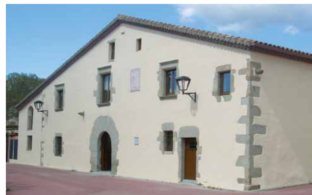
Masia de Can Rahull

Passem per davant de can Rahull, actualment seu provisional de l'ajuntament. Seguint pel mateix carrer trobem el parc Pau Casals, agafem el passeig del Remei a mà esquerra, de pujada (1.460 m, 20 min) si volem podem visitar l'Ermida del Remei. O bé per acabar el passeig, baixar pel passeig fins al carrer Major i tornar a l'Ajuntament fent un recorregut curt.