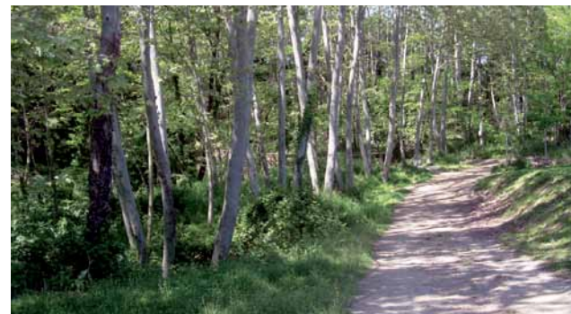
Passejant per la Tordera

Trencant a la dreta, deixem definitivament el Reguissol, fem la pujada, travessem el primer carrer i agafem el carrer Empordà.