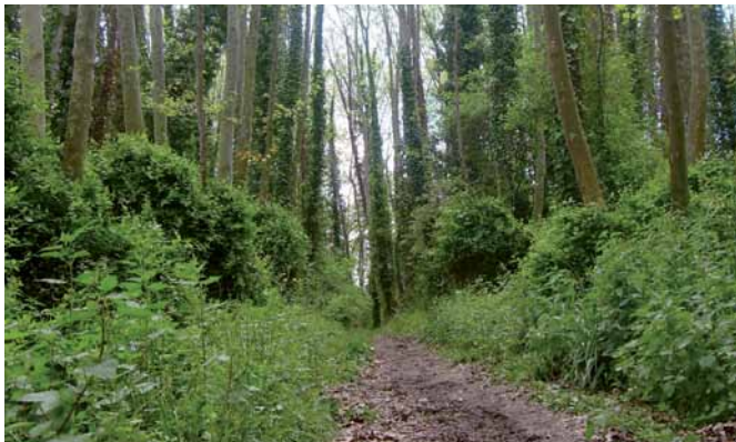
Camí al costat del Reguissol

Enfilem pel camí clar el curs del riu fins trobar una pista asfaltada (750 m, 10 min), l'agafem recta, deixant el carrer a la dreta. El Reguissol, en aquest tram, sempre ens ha de quedar a l'esquerra.