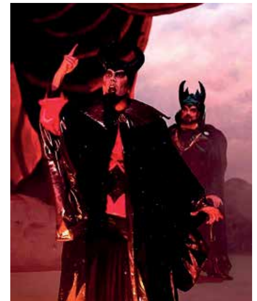
Lucifer i Satanàs

Si per motius aliens als Pastorets cal suspendre la representació, l'entitat no se'n fa responsable