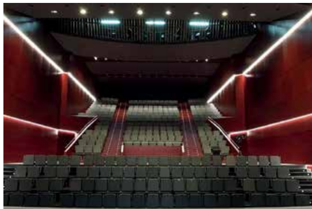
Perspectiva del Teatre Municipal Àngel Guimerà.

Tot plegat, i més de 150 col·laboradors, fem possible que es puguin representar Els Pastorets del Vendrell, altrament considerats com els Pastorets de Catalunya!