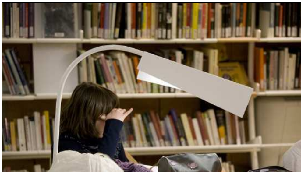
Figura 3. "Uns llibres i un somni...".