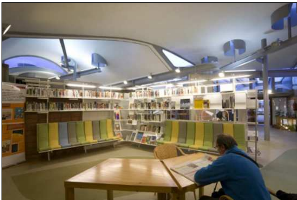
Figura 5. "No guarda cap record del caràcter institucional de les biblioteques".

Josep Llinás reflexionava sobre aquest tema, des del punt de vista de la forma arquitectònica, en el text Sobre la importància relativa de la forma (2002):