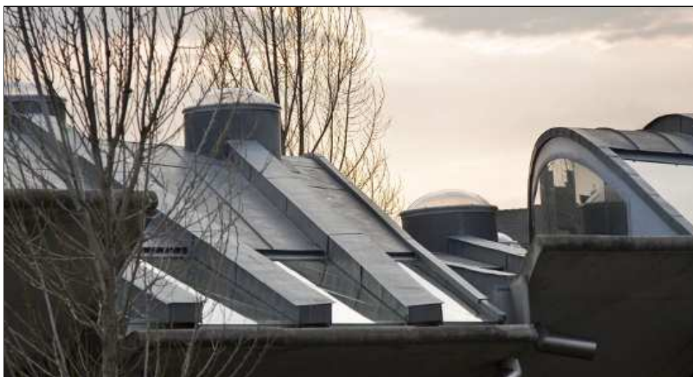
Figura 7. Llibertat per a noves formes i autoritat per acceptar el resultat final.

Miralles i Tagliabue van actuar acceptant que l'evolució d'un projecte, a partir d'una idea inicial, està sotmès a continus canvis i variacions, assumint que aquesta és la naturalesa intrínseca del procés de projecte. Això permet a Miralles i Tagliabue una gran llibertat projectual i alhora permet acceptar, sense contradiccions, el resultat final. Aquest resultat final és incert, certament impredecible a l'inici del procés, però finalment s'arriba a una forma genuïna i coherent amb el lloc i tots els condicionants del procés. Com en tot experiment, si el procés és correcte, finalment no hi ha altra opció que acceptar el resultat, que s'imposa amb autoritat.