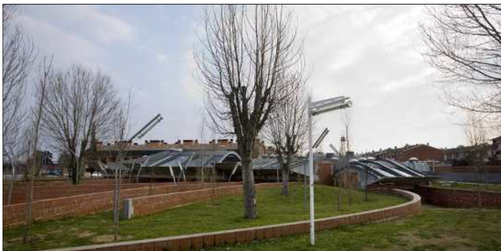
Figura 4. "L'edifici és una construcció qualsevol en un jardí [...] Són uns murs que potser estaven en aquest lloc".

La idea de deixar un edifici com si estigués a mig construir és molt coherent amb la forma de treballar de Miralles. Els seus edificis sempre són obres obertes. "No entender jamás los proyectos como piezas terminadas", també havia dit en una entrevista amb Alejandro Zaera (1995). "Como si la construcción no fuera el momento final del proceso de trabajo, sino una más de los instantes inconexos que siempre están pidiendo una nueva respuesta" (Miralles, 1987b). De la mateixa manera com un diccionari és la foto fixa d'una llengua viva, la biblioteca sempre és un dels instants de la seva evolució, com a projecte de servei i alhora com a edifici, un instant que ha quedat congelat. Els murs que s'estenen des de dins la biblioteca cap al parc permetrien que la biblioteca en el futur continués la seva metamorfosi, desdibuixant els seus límits entre llibres i les fulles seques de pollancre.