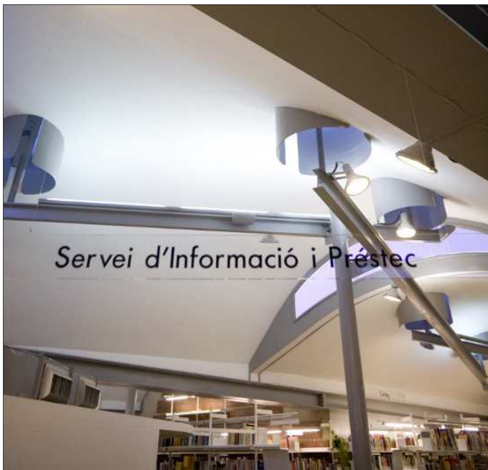
Figura 2. "Allò no és una biblioteca, és una altra cosa!".