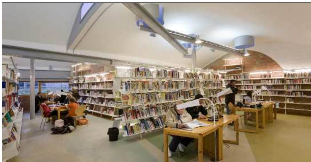
Figura 1. Biblioteca Enric Miralles de Palafolls.

L'edifici és un experiment que utilitza cada desenvolupament del projecte [...] Els seus continus canvis i variacions, així com l'autoritat d'acceptar el resultat final..." ( Biblioteca , 2000).