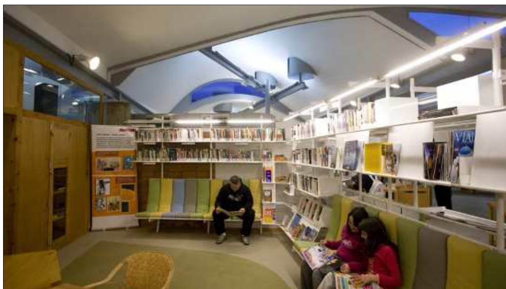
Figura 6. "Donar a la biblioteca un tipus de gravetat de laberint."

Però la idea de laberint em suggereix també l'aspecte lúdic i alegre del joc, de l'enigma intel·lectual, del repte a la intel·ligència. Penso que tot això s'hi pot trobar a Palafolls, i està bé que s'hi trobi a les biblioteques. Les biblioteques han de ser joc, també.