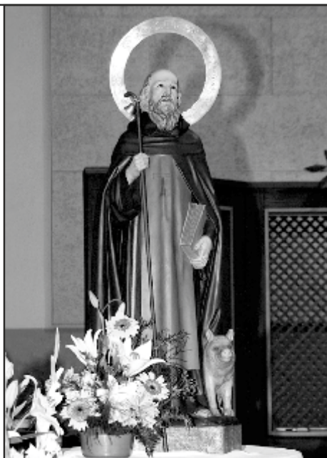
en honor de SANT ANTONI ABAT Patró de menestrals i traginers

A les 12 del migdia, BENEDICCIÓ DE CAVALLERIES, MAQUINÀRIA AGRÍCOLA I ALTRES ANIMALS.