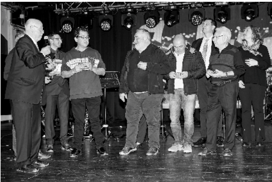
Homenajats 2023 – Colla de llenyataires de Sant Antoni