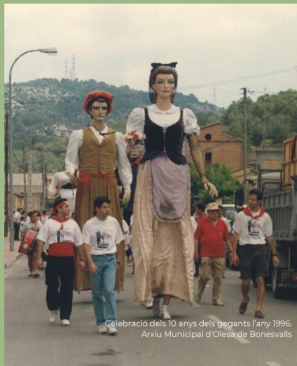
Celebració dels 10 anys dels gegants l'any 1996.

Amb motiu dels 40 anys, els gegants estrenen vestuari el qual ha estat subvencionat per la Generalitat de Catalunya i confeccionat pel Taller Avall de Reus. Uns vestits que mantenen l'essència d'un hereu i una pubilla. Per molts anys més, gegants!